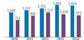
Entwicklung Fördermittel in Mio. Euro

■ Gesamtfördermittel (inkl. institutioneller Förderung) ■ Projektförderung